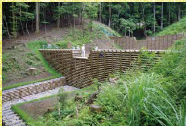
【令和2年度写真コンクール最優秀賞】 「平成31年度林地荒廃防止事業大鹿倉」 向井伸生 (宮崎県宮崎市)