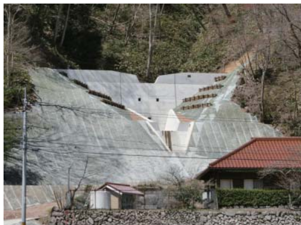
【H29 災害からの復旧状況(溪間対策)】

◆平成29年度（繰越）災害関連緊急治山事業 （浜田市金城町波佐 若生集会所地区）