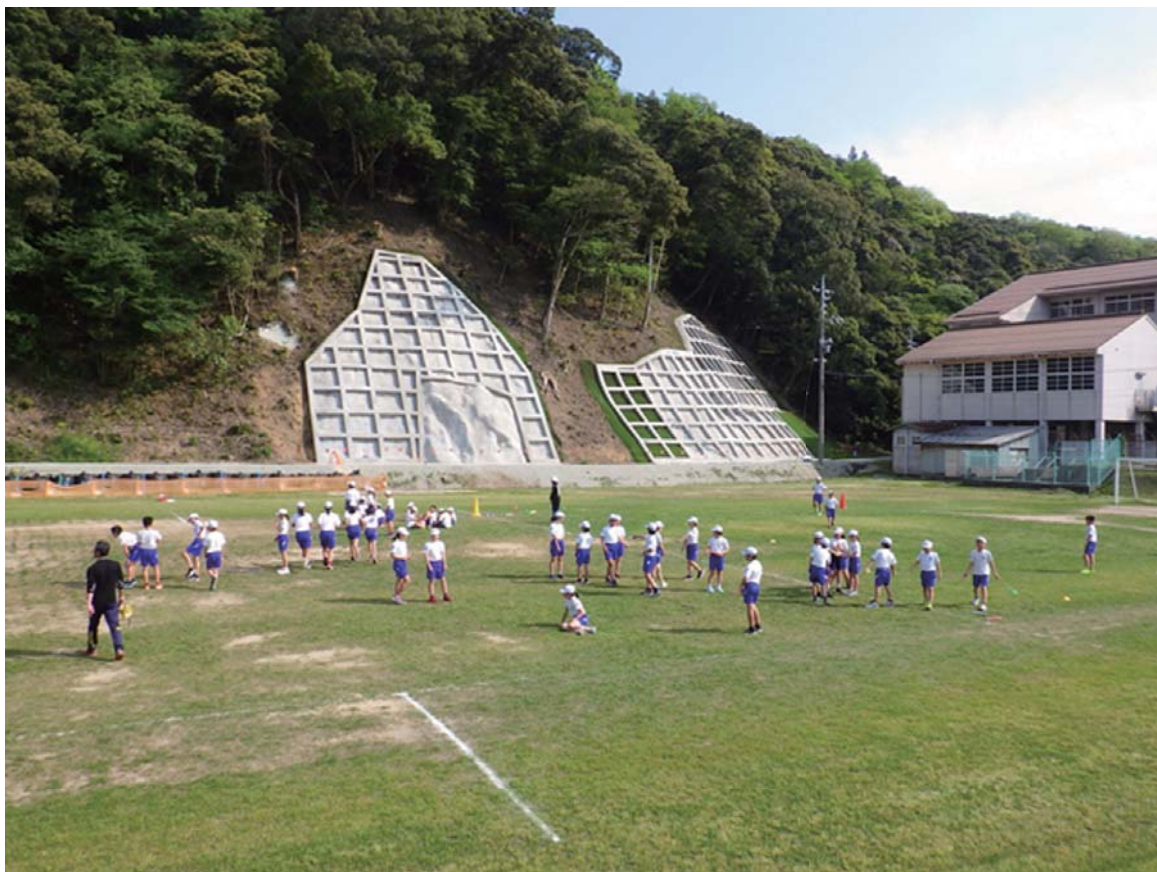
平成 30 年度山地災害防止 標語・写真コンクール