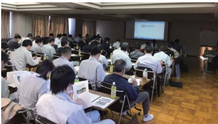
熱心に聴き入る受講者