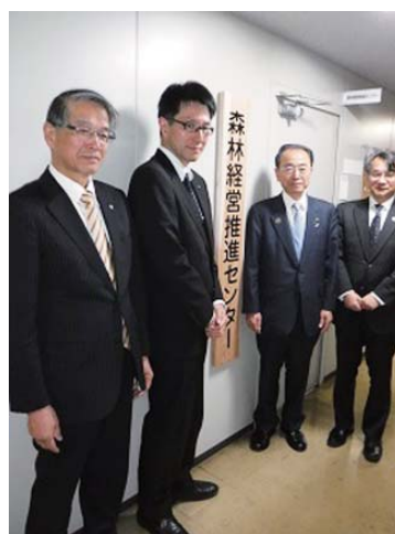
センター看板の設置