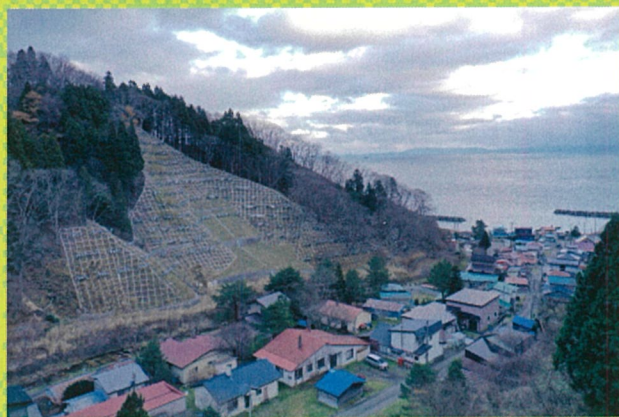
【令和3年度写真コンクール最優秀賞】 「集落を守る治山事業」 北海道函館市 山本竜太郎